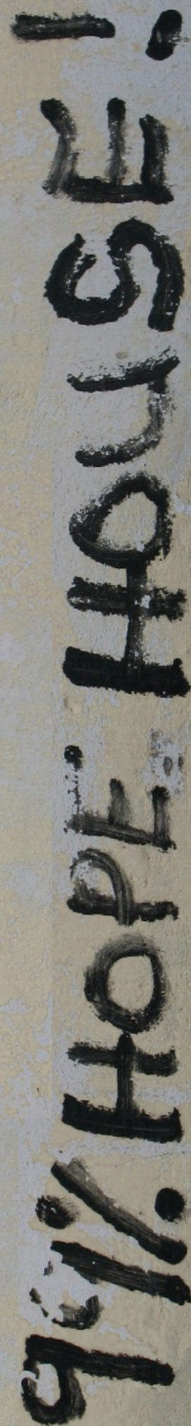
Foto di copertina: "No - pain No - gain 99% Hope house!" Serrekunda, The Gambia (2010)

www.siacantropologia.it convegno.siac.2025@gmail.com